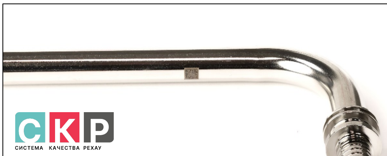
Рисунок 1 – DM код

1.3 Трубка Г-образная имеет маркировку с указанием: